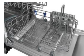
Interior Mucho espacio para la vajilla.