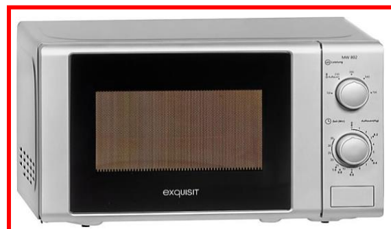
MW 802 silver