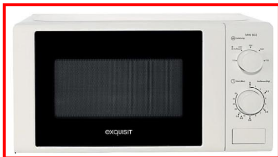
MW 802 blanco