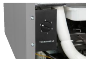
Termostato Sencillo control de temperatura mediante el botón selector.