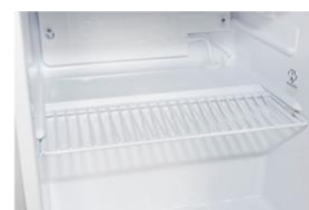
Estante divisorio División óptima del compartimento frigorífico para más orden.