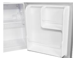
Balconeras en puerta Los prácticos estantes de la puerta garantizan un mayor orden en el frigorífico.